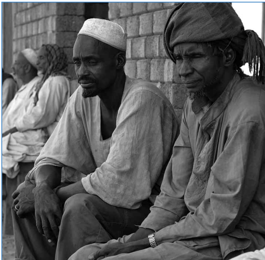
Příslušníci kmene Ambororo na jihu Dárfúru čekají na transport do bezpečné oblasti, který organizuje Mise OSN v Súdánu (UNMIS).

Generální tajemník Ban Ki-moon podnikl v září do Dárfúru a dalších zemí regionu týdenní cestu. Jak řekl po návratu, cílem jeho návštěvy bylo především naslouchat. Místním lidem postiženým konfliktem, humanitárním pracovníkům i představitelům súdánské vlády a vlád okolních zemí. Více o jeho cestě na straně 15.