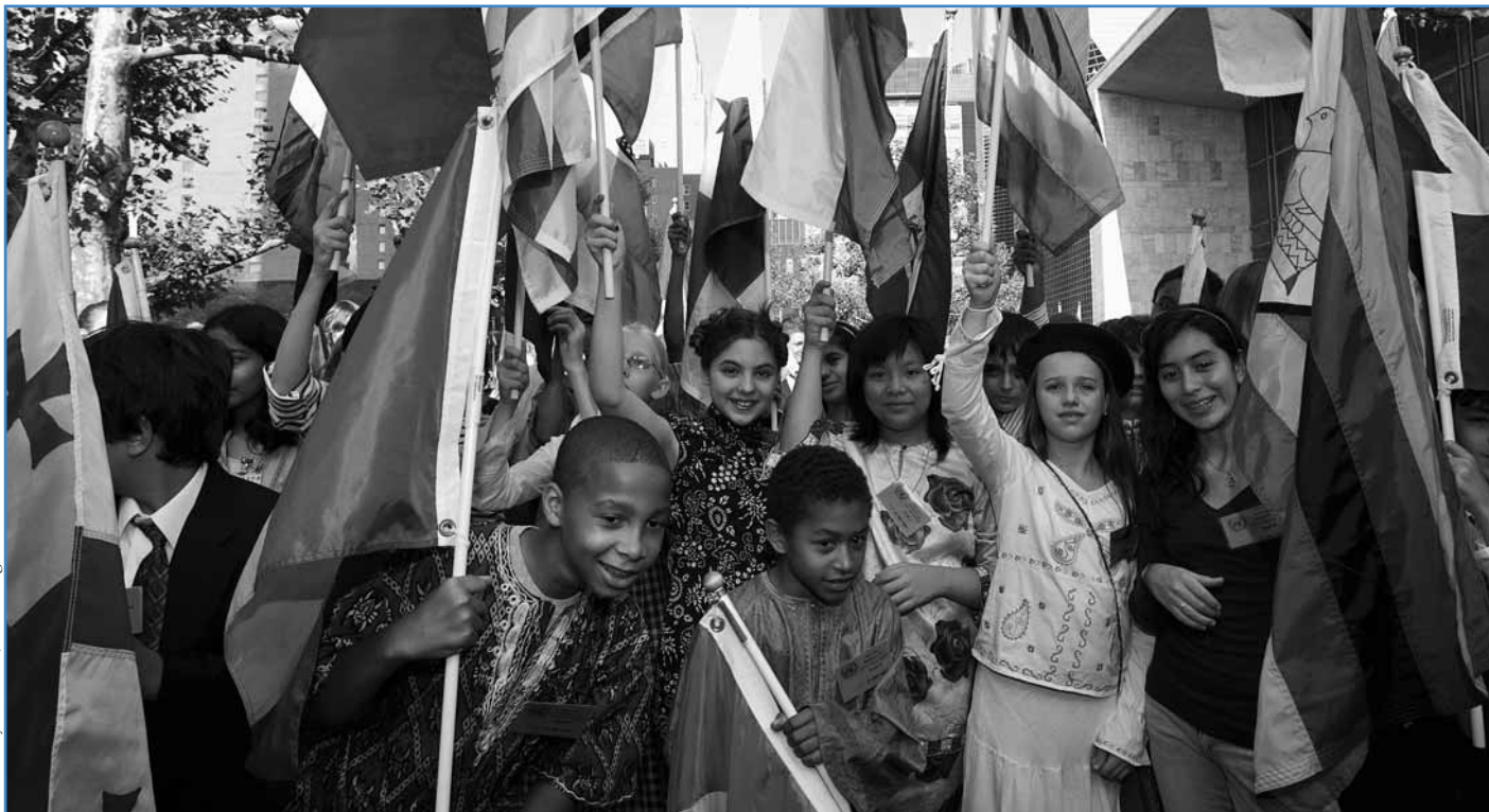
Ilustrační foto: OSN/Paulo Filgueiras