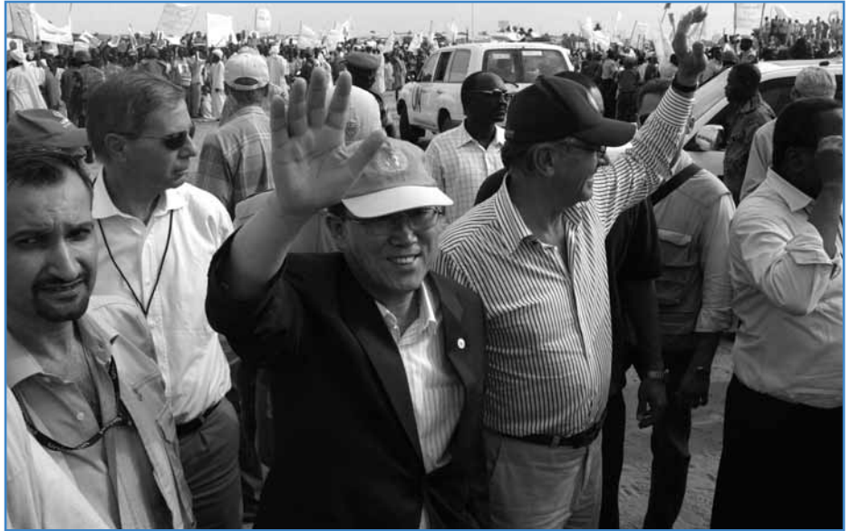
Generální tajemník Ban Ki-moon během zářijové návštěvy v utečeneckém táboře El Salam na severu Dárfúru.

Žádná mírová operace nemůže uspět bez míru, na který má dohlížet. Za neméně důležité považuji, že musíme dál tvrdě tláčit na politické řešení. A to byl samozřejmě jeden z hlavních cílů mé cesty.