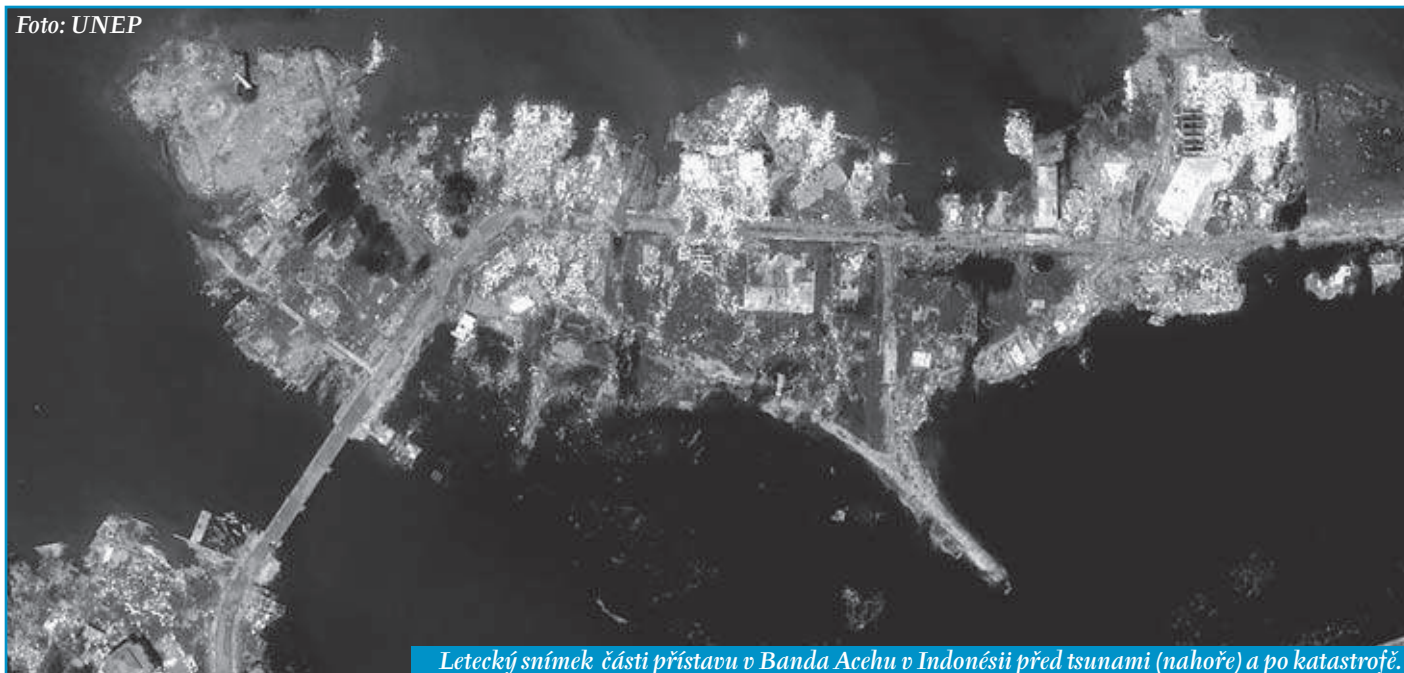
Letecký snímek části přístavu v Banda Aceh v Indonésii před tsunami (nahore) a po katastrofě.