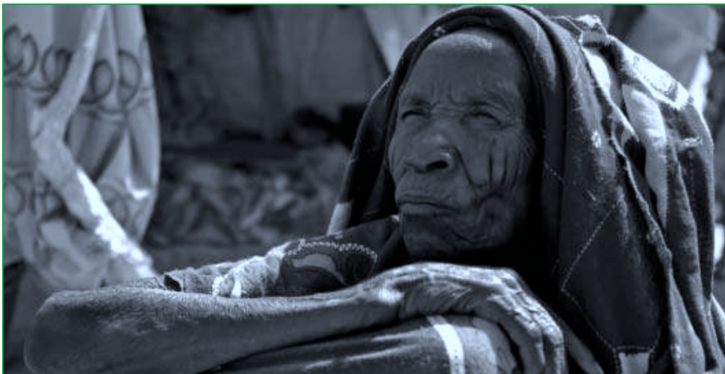
Dárfúrská žena v uprchlickém táboře Iridimi ve východním Čadu.