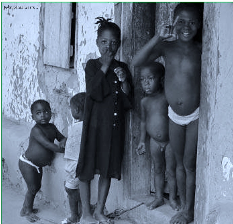
V Africe je osmkrát vyšší dětská úmrtnost než v Evropě. Hlavním důvodem je podvýživa.

soustředit, hladové tělo nechce být iniciativní, hladové dítě ztrácí chuť hrát si a učit se.