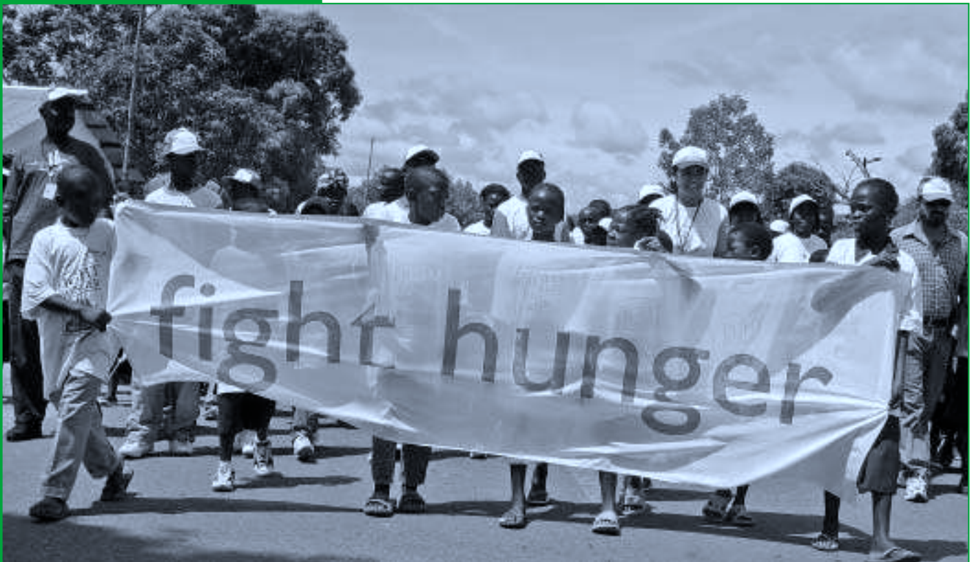
Pochod proti hladu 2006. Tubmanburg, Libérie.

Z údajů Světového potravinového programu ( www.wfp.cz )