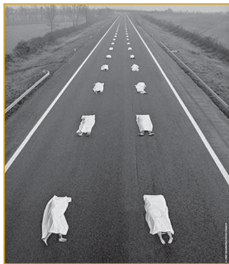
Varovný plakát WHO ke kampani.