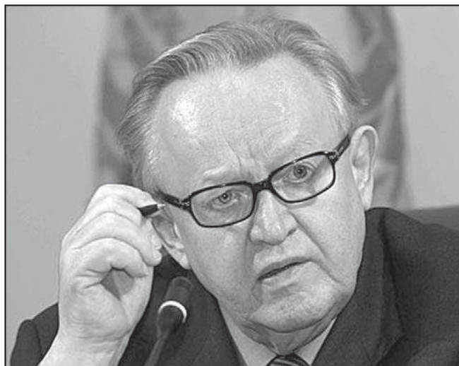
Zvláštní zmocněnc generálního tajemníka OSN Martti Ahtisaari na tiskové konferenci ve Vídni po ukončení jednání mezi srbskou a kosovskou stranou.

Provizorní plán, který zvláštní zmocněnc generálního tajemníka OSN předložil 2. února, se zabývá požadavky na vznik multietnické společnosti, jejíž ústava obsahuje potřebné zása-