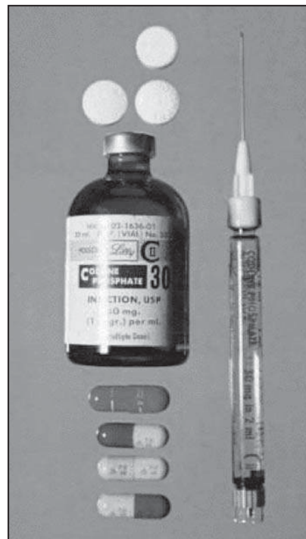
Ilustrace: foto: internet

Výroční zpráva INCB se zabývá také hlavními trendy zneužívání a pašování drog v jednotlivých regionech světa. V Afghánistánu se v roce 2006 zvýšilo ilegální pěstování opiového máku o 59 procent a výroba drog stoupla téměř o polovinu na rekordních 6 100 tun. Pašování afghánského opia může mít destabilizující vliv na sousední země, stredoasijské republiky i Ruskou federaci. Organizovaný zločin, korupce i vysoká poptávka po opiátech na nelegálních trzích je v těchto zemích na výrazném vzestupu.