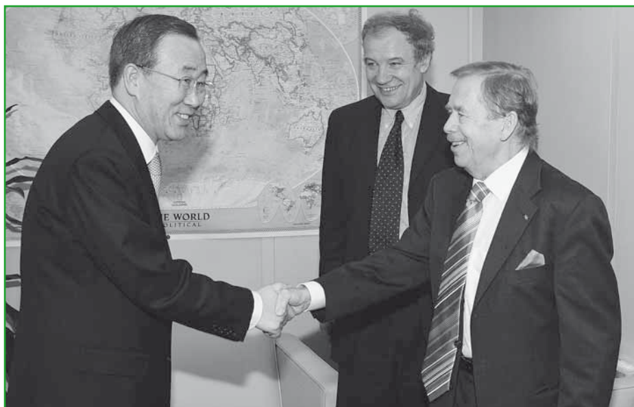
Generální tajemník Ban Ki-moon se krátce po svém zvolení setkal v New Yorku s bývalým prezidentem České republiky Václavem Havlem a českým velvyslancem při OSN Martinem Palouškem.

Upozornil, že morálka zaměstnanců je zatížena tvrdou a v mnoha případech neoprávněnou kritikou práce Sekretariátu. „Ne každá kritika je oprávněná, ale měla by pro nás být varováním a donutit nás přijmout taková opatření, která podobnou kritiku znemožní,“ řekl Ban Ki-moon.