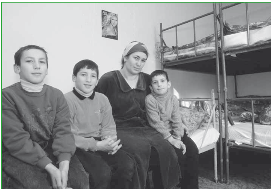
Uprchlíci v pobytovém středisku v Zastávce u Brna, leden 2004.

Naprostá většina respondentů si myslí, že uprchlíci by měli být v České republice přijímáni. Důvody přijetí vnímají mnohem velkoryseji než státní úřady. Zároveň se ale domnívají, že by Českou republiku měli opustit, až se situace v jejich zemi zlepší, nebo bude-li je moci přijmout jiná země.