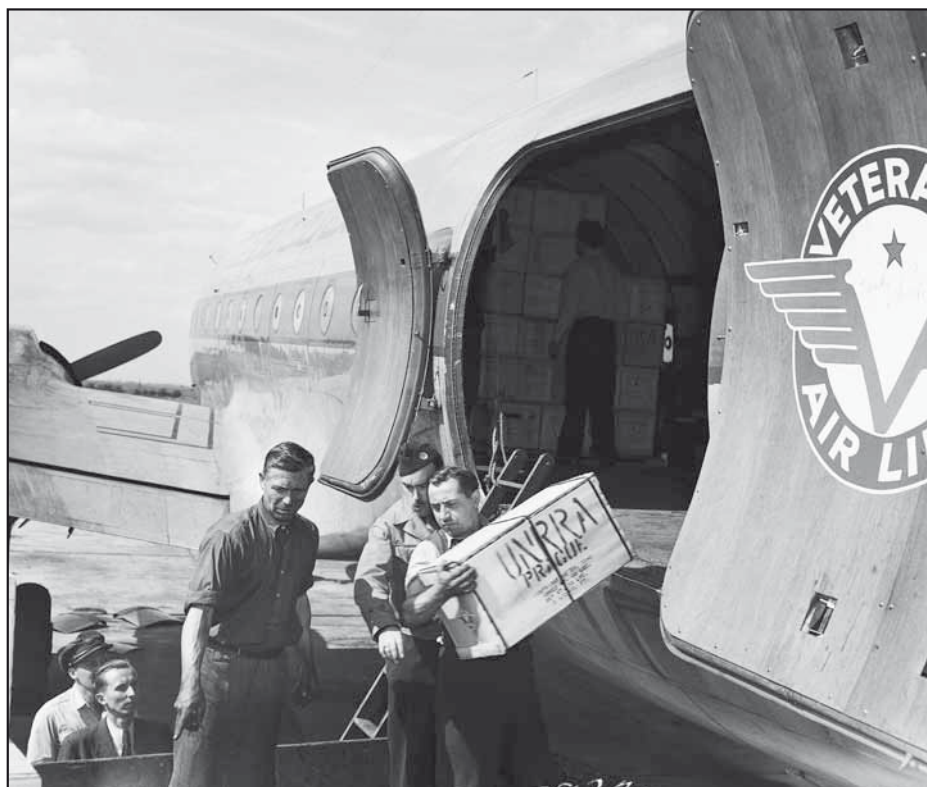
Československo, 1946. Z letadla společnosti Veterans' Air Line je na letišti v Praze vykládána zásilka pomoci UNRRA. Program UNRRA na pomoc dětem převzal po roce 1949 UNICEF, ostatní programy pomoci další agentury OSN.

„Pro každé dítě zdraví, vzdělání, rovnoprávnost, ochrana.“ To je motto práce Dětského fondu OSN – UNICEF, který již šedesát let pomáhá zranitelným dětem na celém světě.