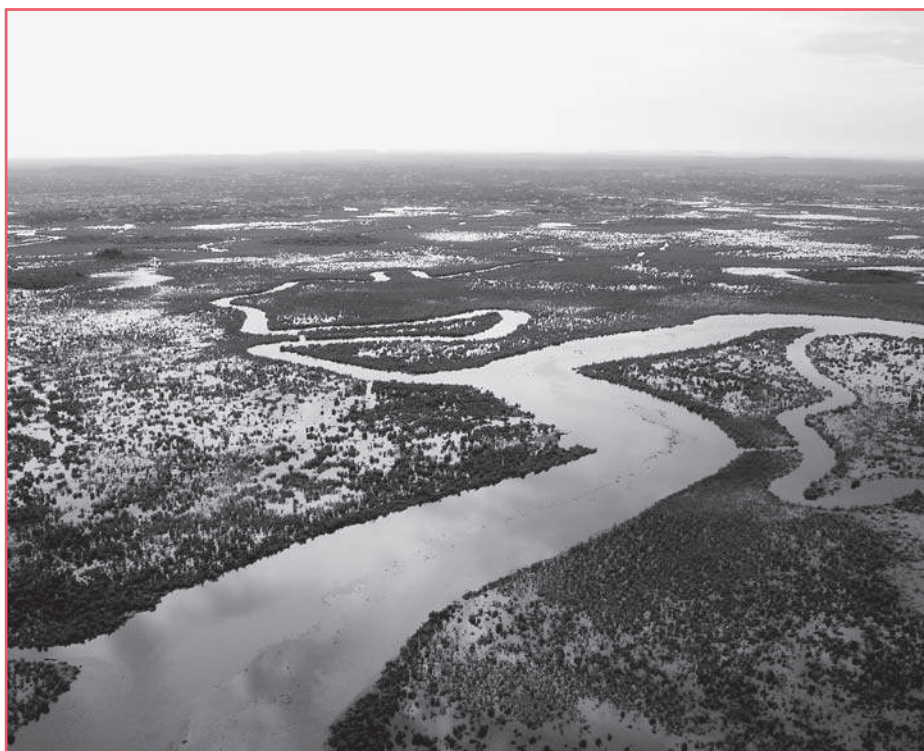
Budeme se umět přizpůsobit následkům změny klimatu?

V keňské metropoli Nairobi proběhla důležitá konference o klimatických změnách. V sázce je skutečně mnoho. Důsledky klimatických změn se mohou projevit prakticky ve všech sférách lidského života. Přímý vliv mohou mít i na oblast míru a bezpečnosti. Až příliš často je však tato otázka považována pouze za problém životního prostředí, ačkoli by měla být součástí širší rozvojové a ekonomické agendy. Dokud neuznáme všeobecnou povahu této hrozby, nebude naše reakce na ni dostačující.