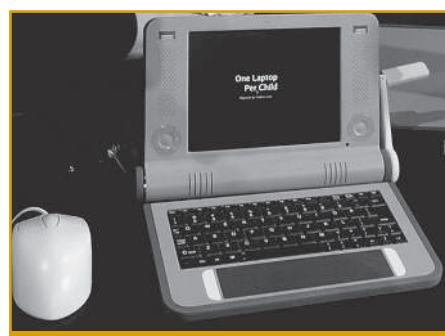
V Tunisu byla také odstartována iniciativa stodolarového laptopu určeného zejména pro obyvatele rozvojového světa.

„Lepší přístup k informačním technologiím může přispět ke zdokonalení farmářských praktik a napomoci