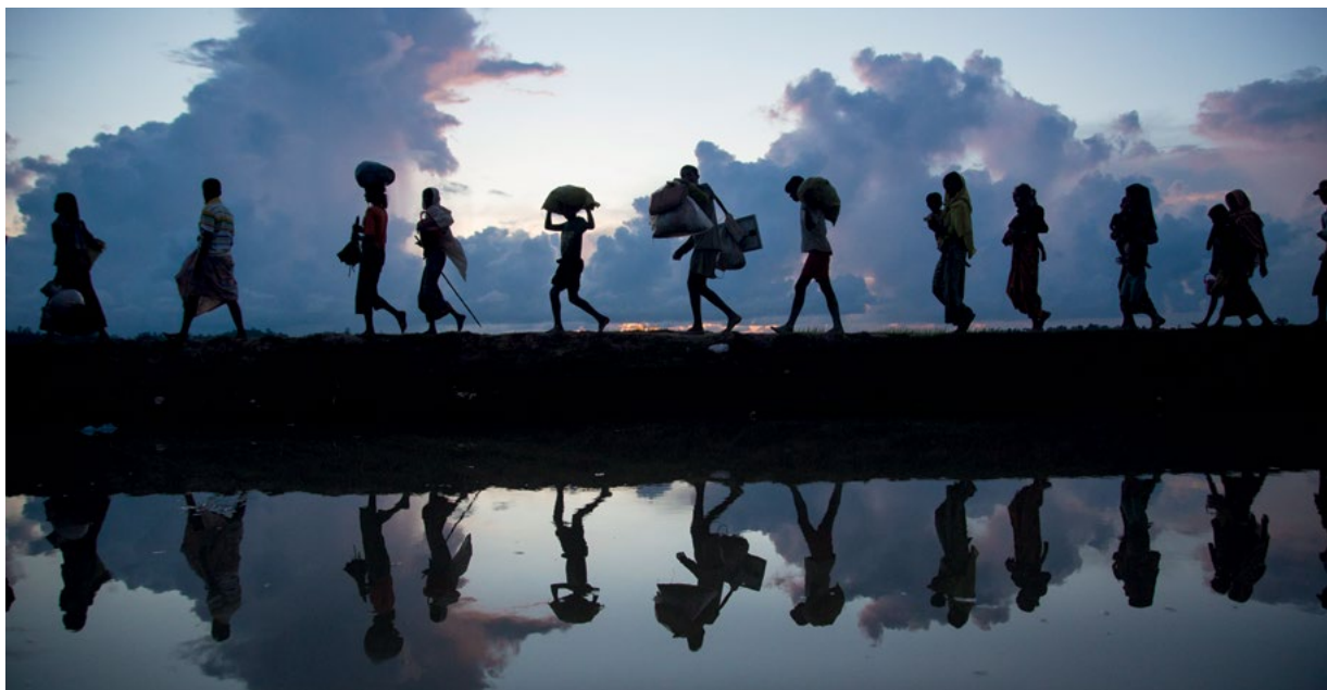
Rohingští uprchlíci překračují v říjnu 2017 bangladéšskou hranici.