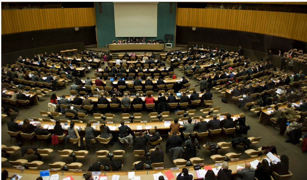
Dialog Vysokého komisaře o výzvách při ochraně v roce 2017, na kterém byl zhodnocen pokrok dosažený při přípravě globálního paktu o uprchlících a který předcházel vydání „nulového návrhu“ v lednu 2018.

Na základě tohoto procesu vydalo UNHCR 20. července 2018 návrh globálního kompaktu o uprchlících . Snahou bylo vytvořit praktický a snadno použitelný text tak, aby vyváženě zohledňoval různé, někdy i odlišné názory a aby stavěl na oblastech, v nichž panuje shoda.