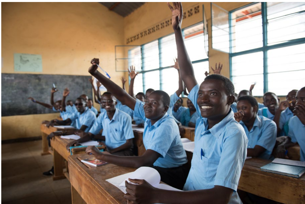
Burundští uprchlíci a příslušníci místní rwandské hostitelské komunity společně navštěvují školu Paysannat School ve východní Rwandě.