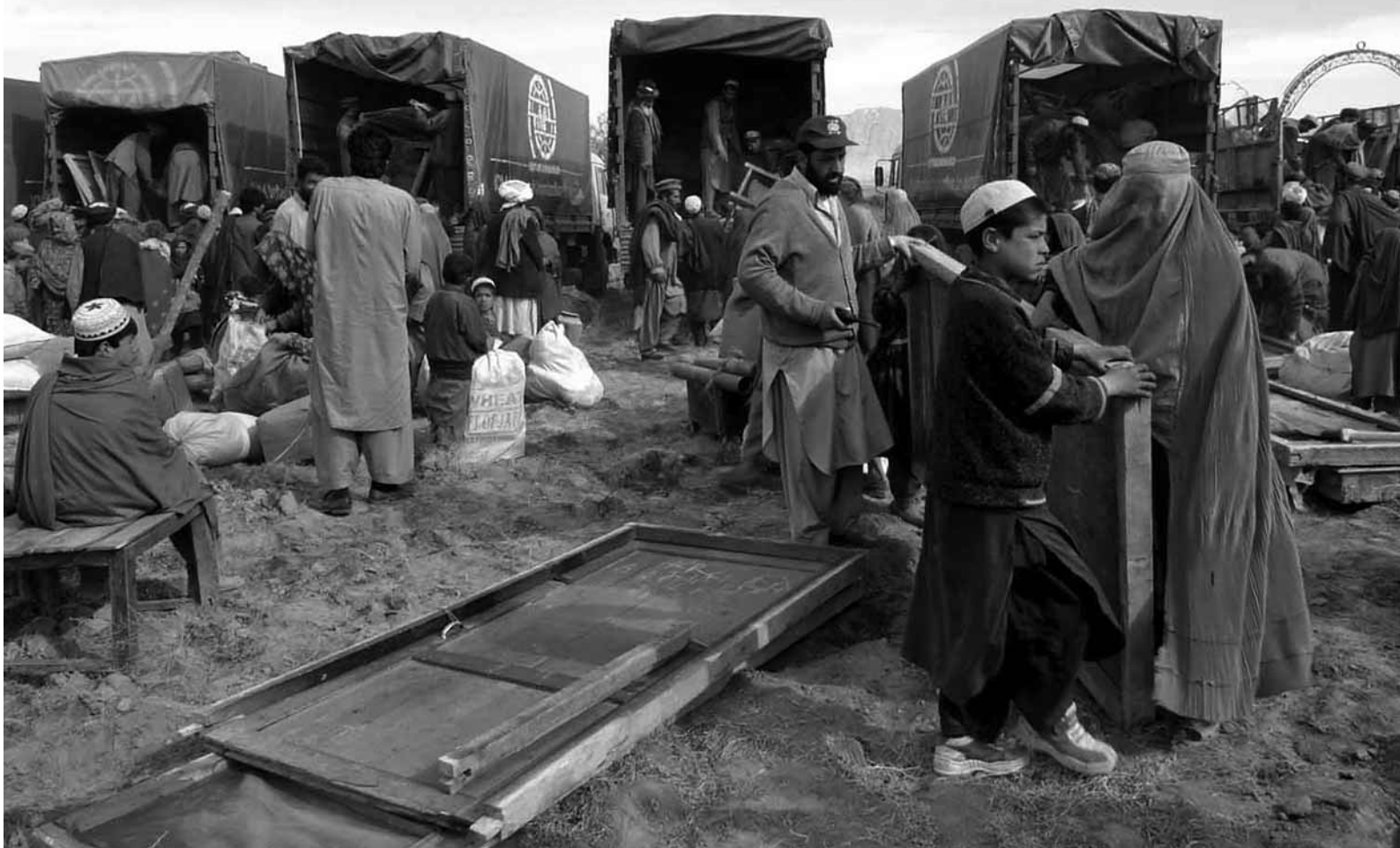
V Afghánistánu pomohlo UNHCR příslušníkům 200 rodin, kteří se spontánně rozhodli vrátit domů z Pákistánu. Po návratu zjistili, že jejich pozemky byly zabrány jinými lidmi. UNHCR jim proto poskytlo dočasné přístřešky, peněžní půjčky a nádrže s pitnou vodou. Přizvalo další humanitární organizace, aby se podílely na přípravě na zimu. Dětem zajistilo provizorní školy. Případ těchto rodin je smutným důkazem toho, že návrat do země původu není snadný a vyžaduje širokou podporu.