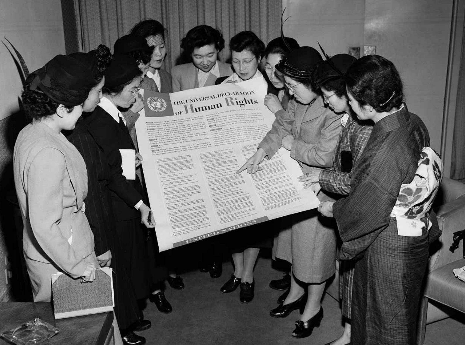
Lake Success, 1950. Skupina japonských žen diskutuje nad Všeobecnou deklarácí lidských práv. ✓