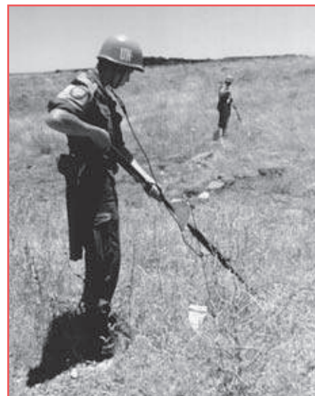
Polský voják odminovává území oddělení. (Foto OSN, 1974)

V prosinci 1981 se izraelská vláda rozhodla uplatňovat izraelskou legislativu na území okupovaných Golanských výšin. Proti tomuto kroku však Sýrie silně protestovala a Rada bezpečnosti i Valné