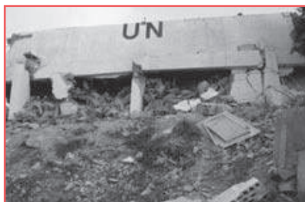
Pozorovatelská stanice OSN u jiholibanonského města Chiam zasažená během letectvého bombardování 24. července.

Rada bezpečnosti již dříve prostřednictvím svého předsedy reagovala na dva incidenty tohoto konfliktu. Jedním bylo zabití čtyř neozbrojených vojenských pozorovatelů OSN, příslušníků Pro-